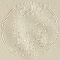
figura alaba randa pero al co vha de m paiv el bu debe que del d lo qu man dece yel de s que se d fren regr